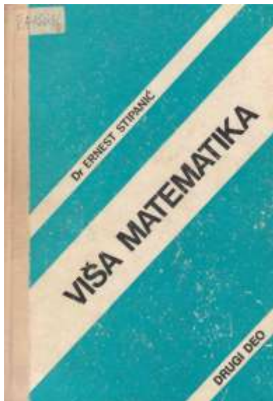
Насловна страна уџбеника „Виша математика II” Ернеста Стипанића, 1978. година (Библиотека Грађевинског факултета)